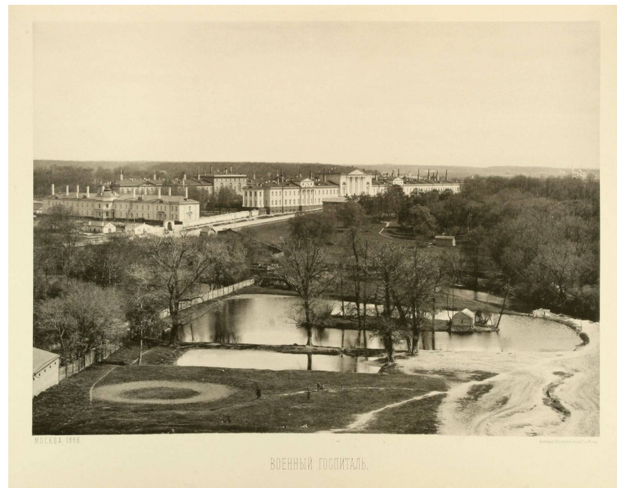
Московский военный госпиталь.