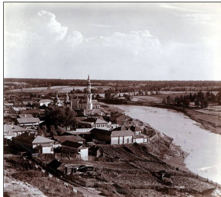
Верхотурье. Вид на Покровский монастырь.

А.А.Вырубова и полковник Д.Н.Ломан, это первое место паломничества Григория Распутина, где он проник в суть бытия, что и помогло ему позднее стать провидцем и снискать доверие царской семьи.